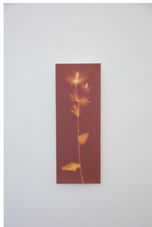
Eryngium alpinum (Alpen-Mannstreu) Lumenprint auf ILFORD MG ART, Multigrade Art 300 Hahnemühle Fine Art Aufgezogen auf Karton mit Leistenrahmen Holz 15 x 40,3