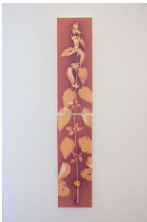
Urtica dioica (Brennnessel) Lumenprint auf ILFORD MG ART, Multigrade Art 300 Hahnemühle Fine Art Aufgezogen auf Karton mit Leistenrahmen Holz 15 x 40,3 (zweiteilig)