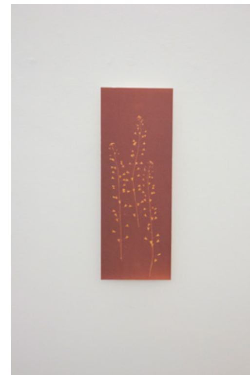
Capsella bursa pastoris (Hirtentäschelkraut) Lumenprint auf ILFORD MG ART, Multigrade Art 300 Hahnemühle Fine Art Aufgezogen auf Karton mit Leistenrahmen Holz 15 x 40,3