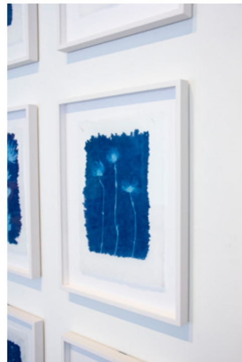
Taraxacum officinale (Löwenzahn, Samenstand) Cyanotypie auf Ino Shi (Japanisches Seidenpapier) 30 x 39,5 Unikat