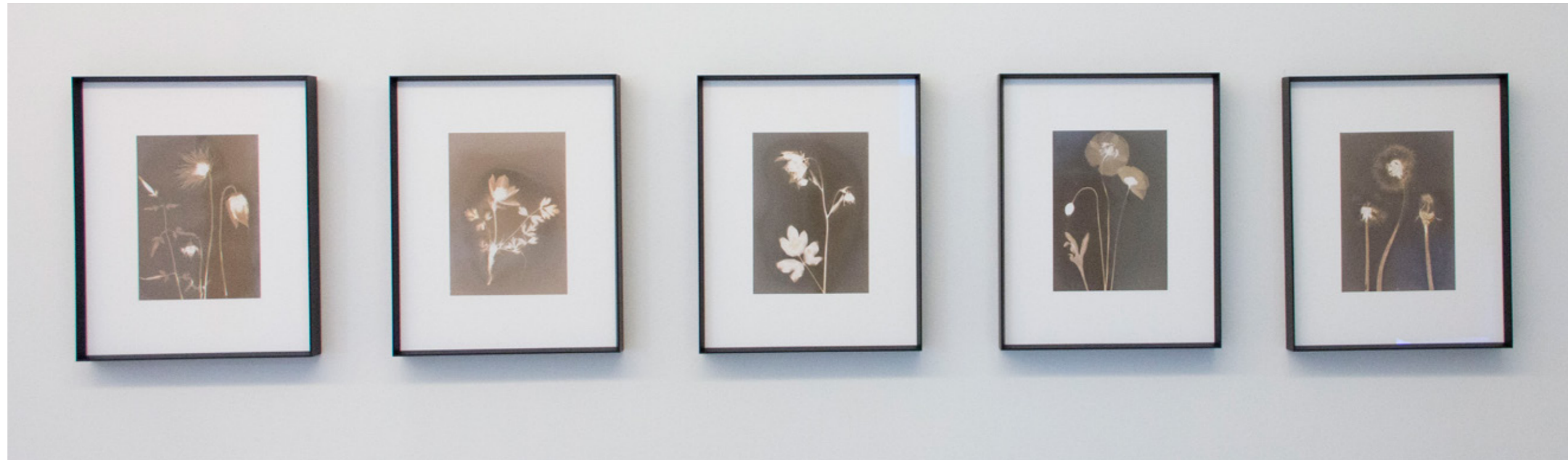
Clematis tangutica (Mongolische Waldrebe) Lumenprint auf ILFORD MG IV, Multigrade IV, RC De Luxe Glossy 24 x 30 cm Unikat