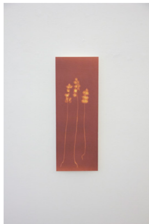
Rhinanthus (Klappertopf, Samenstand) Lumenprint auf ILFORD MG ART, Multigrade Art 300 Hahnemühle Fine Art Aufgezogen auf Karton mit Leistenrahmen Holz 15 x 40,3