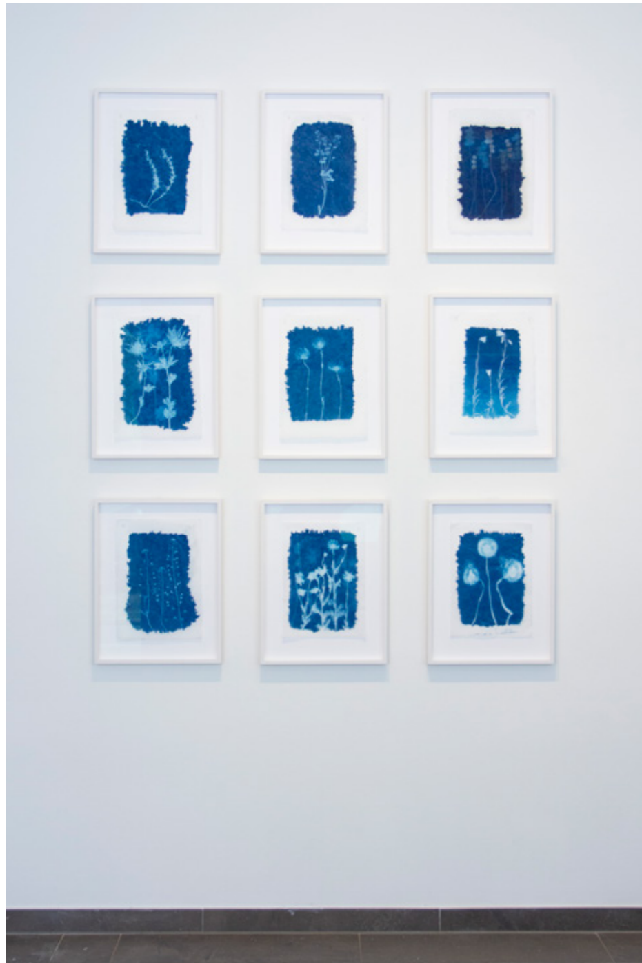
Galium verum (Echtes Labkraut) Cyanotypie auf Ino Shi (Japanisches Seidenpapier) 30 x 39,5 Unikat