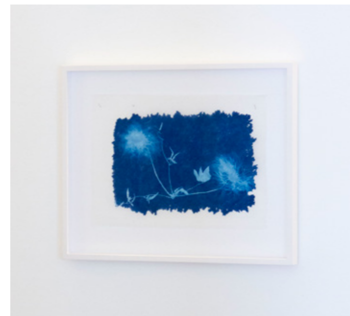
Clematis tangutica Mongolische Waldrebe Cyanotypie auf Ino Shi (Japanisches Seidenpapier) 39,5 x 30 Unikat VERKAUFT